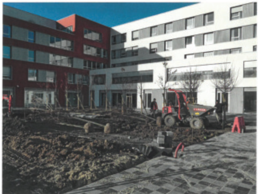
Format paysage, Pauline Heutin

La composition privilégie un vocabulaire systématique. Une trame rigoureuse de deux mètres sur deux mètres permet de gérer l'ensemble des calepinages des sols et des plantations ainsi que la distribution des salons urbains. Son respect strict a permis d'agencer les espaces pavés sans avoir besoin de réaliser des découpes ou des reprises. Le sol est